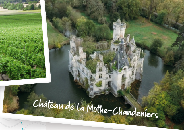
Château de La Mothe-Chandeniers