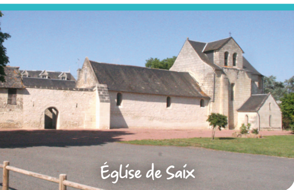
Église de Saix

Aux confins du Poitou et de l'Anjou, Saix offre aux visiteurs son hameau poitevin, marqué par le souvenir de sainte Radegonde.