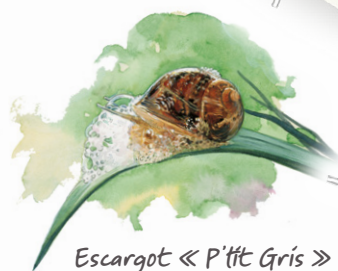
Escargot « P'tit Gris »