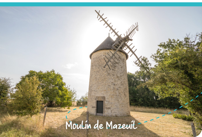
Moulin de Mazeuil

Depuis les berges de la Dive vous découvrirez un paysage de vallons et de coteaux escarpés.