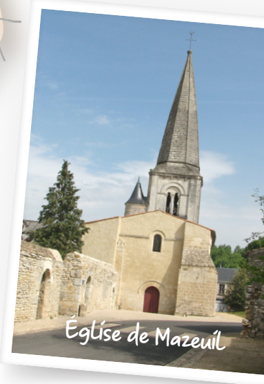
Église de Mazeuil