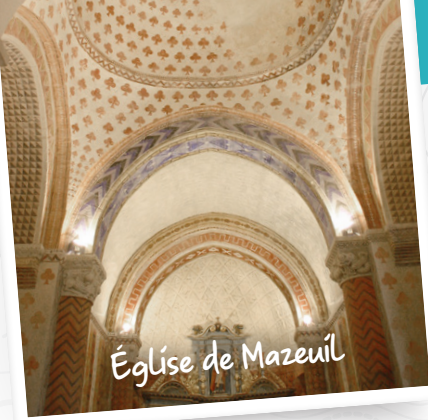
Église de Mazeuil