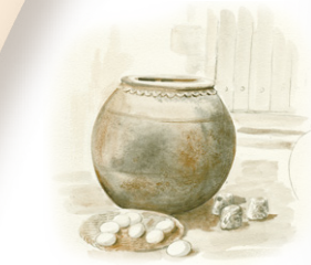
Les pônes et les pônons, nombreux dans les fermes de la région G. Manreza