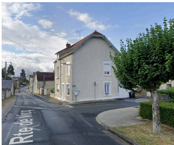
Etape 4 : Tourner à droite sur la Route de Crémille et continuer tout droit sur 1,4km.