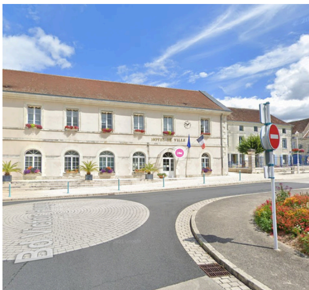
Etape 1 : Tourner à droite sur la Rue Pierre Denis Rousseau.