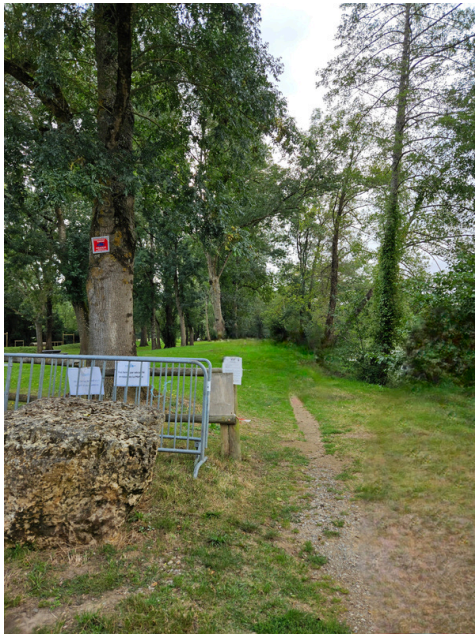
Paso 17: Continúe recto por el camino peatonal.