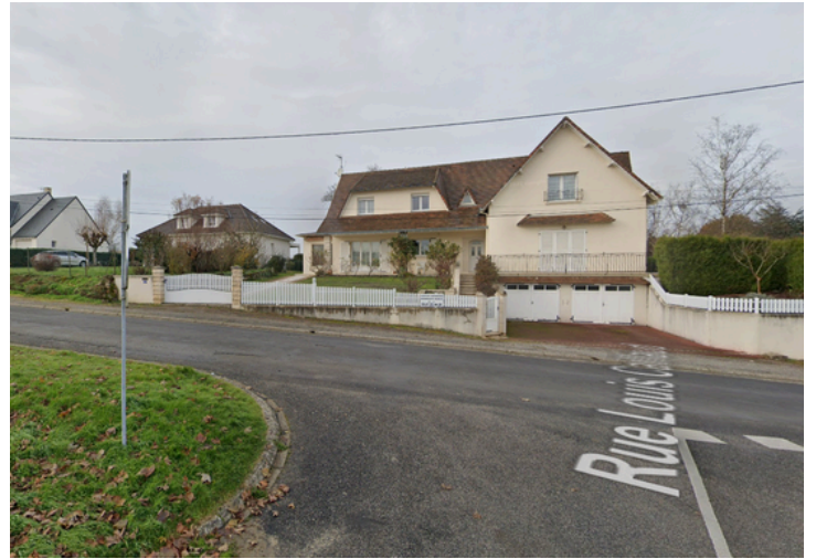
Etape 2 : Tourner à gauche sur la Rue Renoir, puis continuer tout droit.