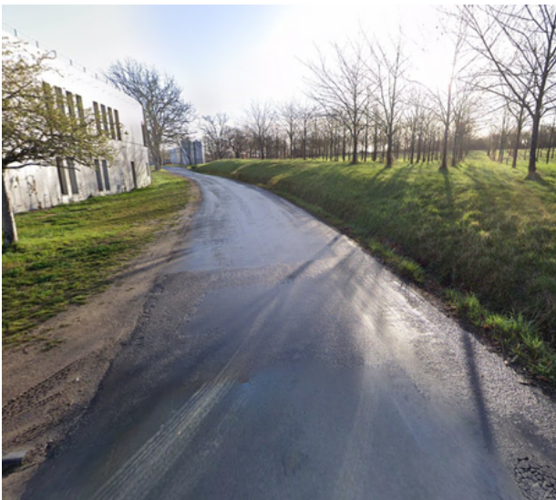
Etape 7 : Tourner à gauche.