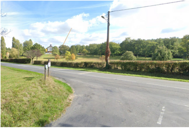
Etape 5 : Prendre à gauche et continuer sur 220m.