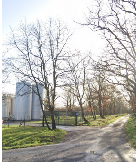
Etape 8 : Tourner à droite sur le chemin piéton.