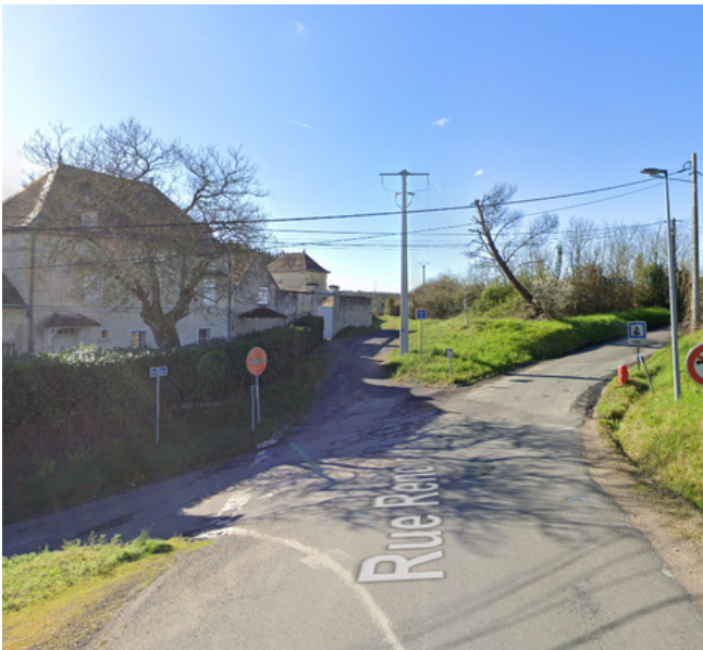
Etape 3 : Continuer tout droit sur le Chemin du Golf.