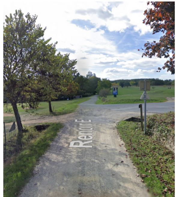
Etape 4 : Continuer tout droit sur 450m.