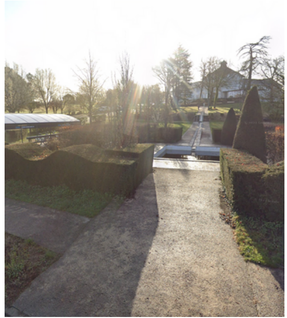
Etape 6 : Tourner sur le chemin et continuer tout droit jusqu'à la prochaine étape.