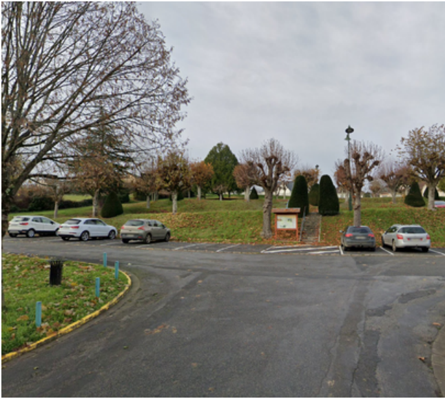
Etape 1 : Monter la Rue Louis Caillaud.