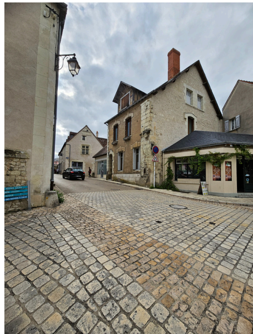
Etape 20 : Tourner à gauche sur la Rue Bourbon et continuer tout droit jusqu'à la Place de la République.