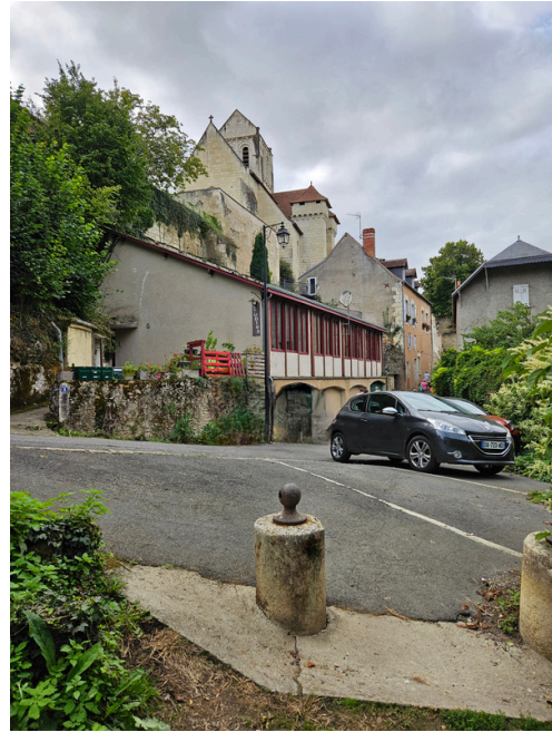
Etape 18 : Au bout du chemin, tourner à droite sur la Rue des Remparts.