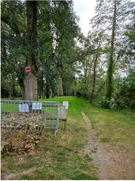
Etape 17 : Continuer tout droit sur le chemin piéton.