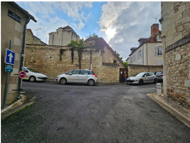
Etape 19 : Au bout de la rue, tourner à droite sur la Rue Notre-Dame.