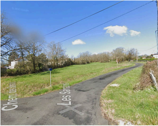
Paso 10: Gire a la derecha en Rue des Hirondelles.