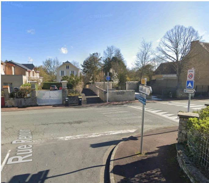
Paso 4: Gire a la derecha en Rue Pierre Denis Rousseau y luego directamente a la izquierda en Parc des Confluences. Cruzar el parque.