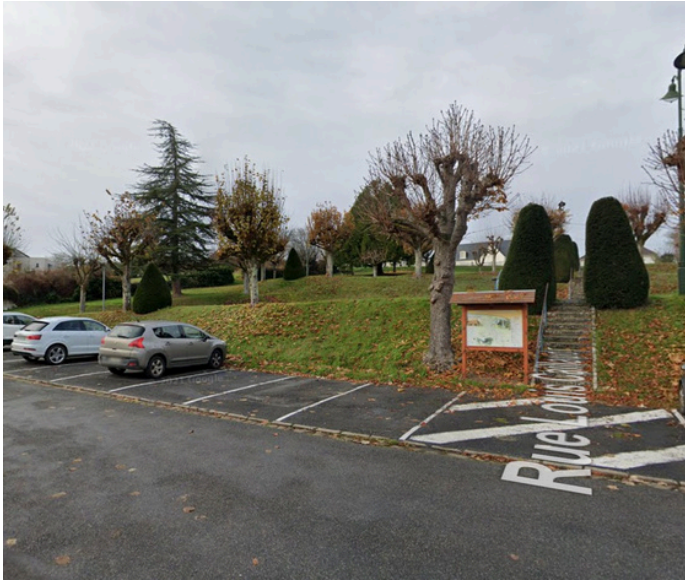
Paso 2: Vuelve a subir por Rue Louis Caillaud.