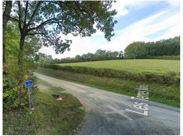
Paso 11: Gire a la izquierda en Rue des Terres Noires y continúe recto durante 1,9 km.