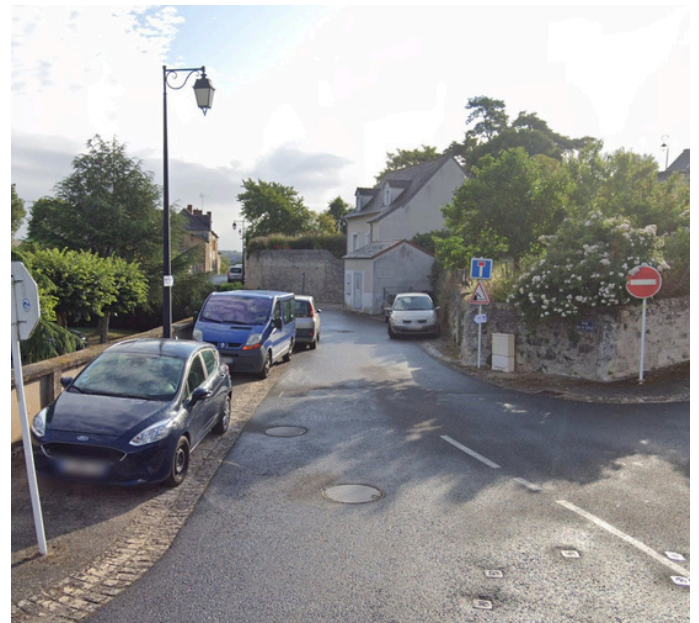
Paso 5: A la salida del parque, tome la Rue de la Cale de enfrente y siga por la calle.