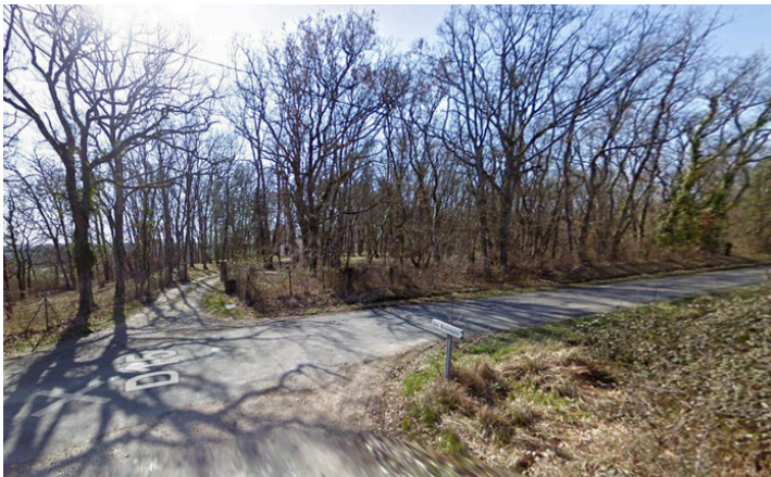
Paso 12: En el cruce, gire a la derecha por la D15. Luego continúe recto durante 450 m.