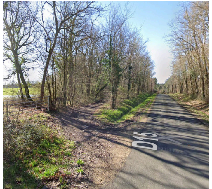
Paso 13: Gira a la izquierda por el sendero y sigue la ruta del siguiente paso.