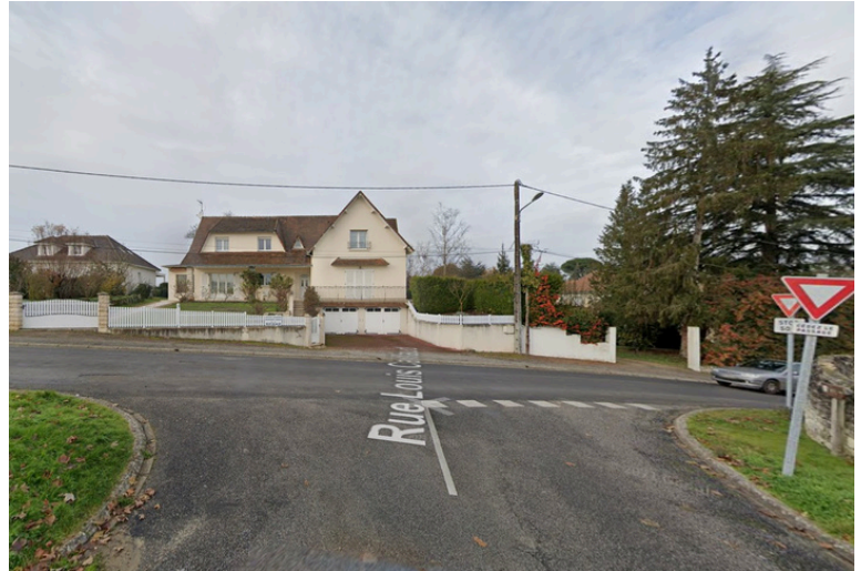
Paso 3: Gire a la derecha en Rue Renoir.