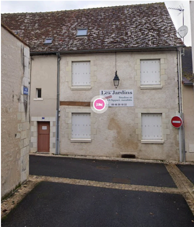
Paso 10: Al final de la calle, gire a la izquierda en Rue Saint-Barthélemy.