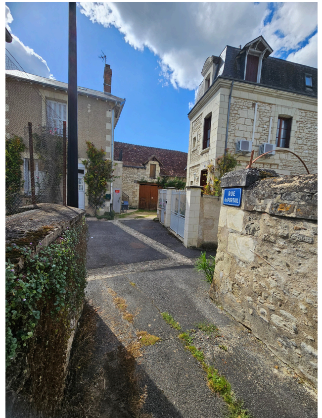
Paso 13: Al final del camino, gire a la derecha y continúe hasta el final de Rue Mirabeau.