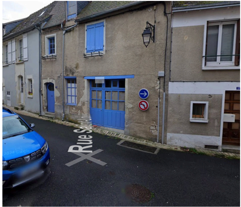
Paso 11: Gire a la derecha en Rue Saint-Louis y continúe unos metros.