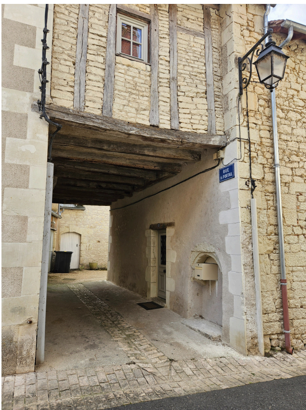
Paso 12: Gire a la derecha en Rue du Portail y continúe hasta el siguiente cruce.