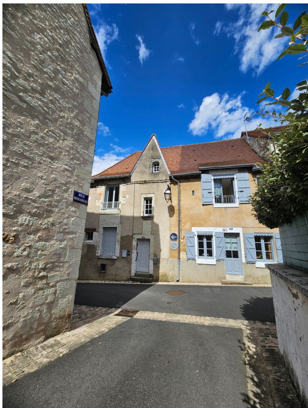
Etape 14 : Tourner à gauche sur la rue Saint-Louis.