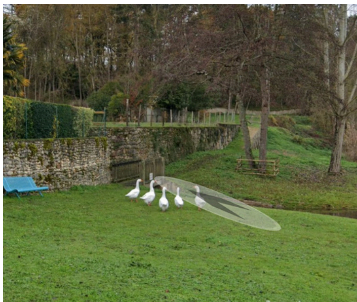
Etape 16 : Tourner à gauche pour rejoindre le chemin et passer sur le pont pour rejoindre la fin de la Rue des Tanneries. Remonter la Rue des Tanneries.