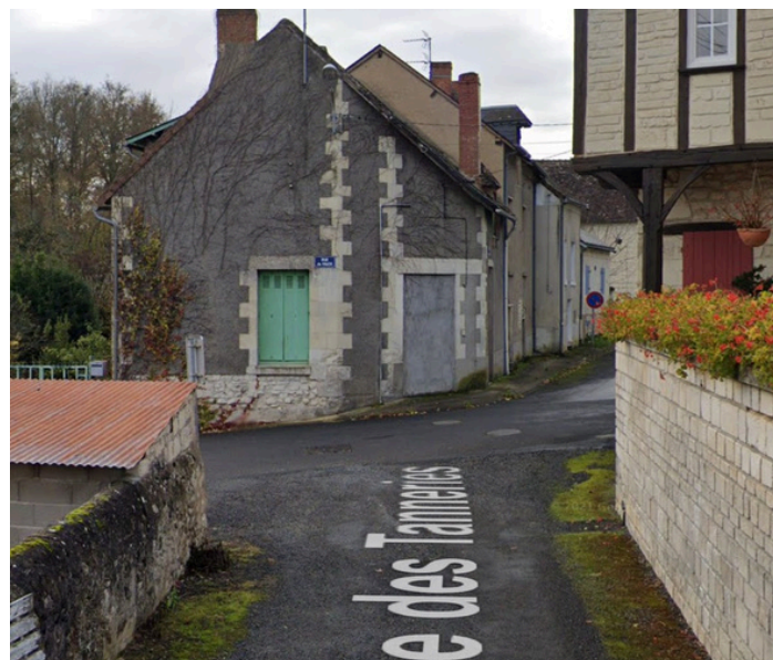
Etape 17 : Tourner à gauche sur la Rue du Falk et traverser le pont.