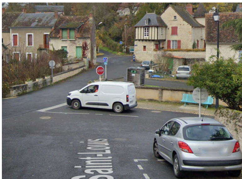
Etape 15 : Tourner à droite sur la Rue de la Cale et continuer au bout de celle-ci.