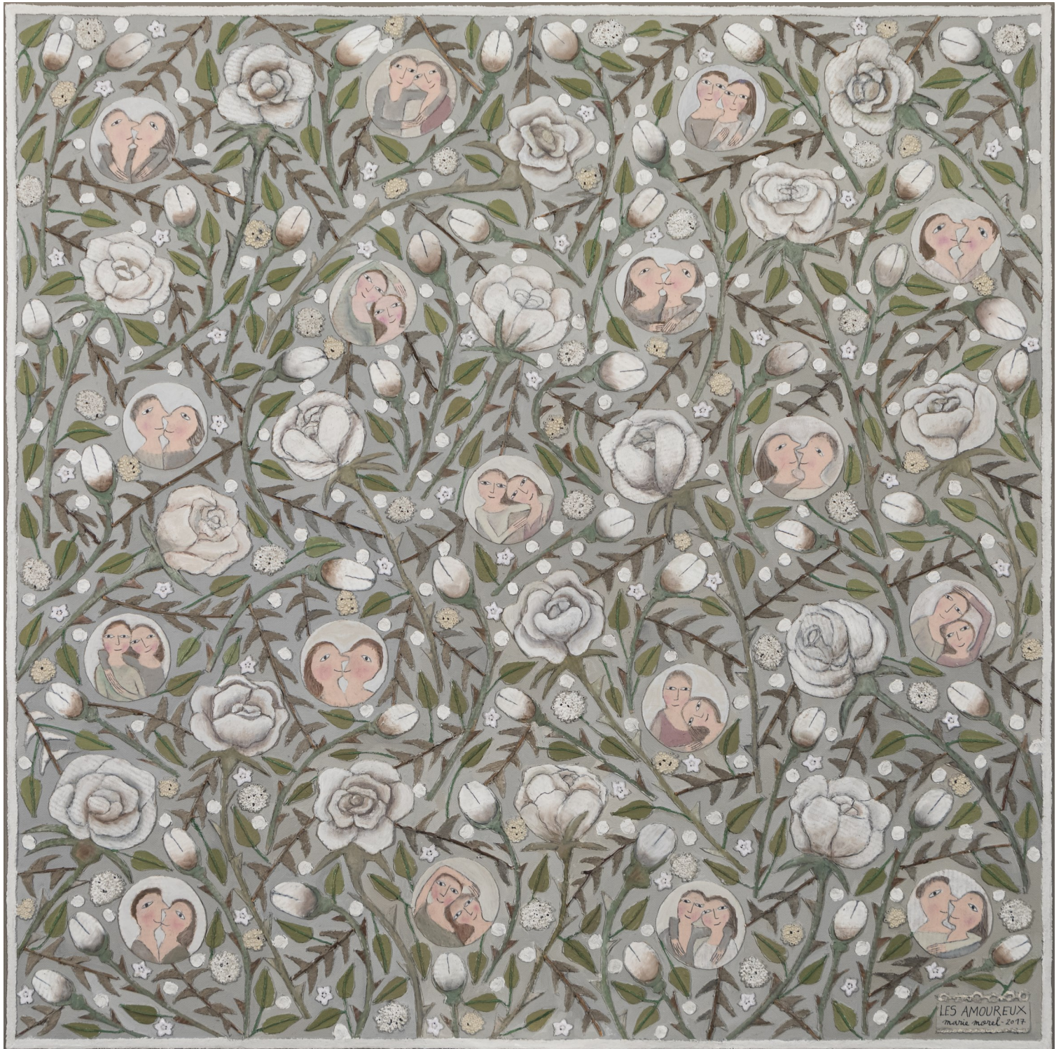
Les Amoureux 2, 80x80

Pascal Quignard, Ecrivain, lauréat du Prix Goncourt